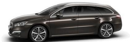
Peugeot 508 I Kombi (2010-2018)

Instrucciones de instalación Istruzioni per l'installazione Upute za sastavljanje Instrucțiuni de montaj Návod na montáž