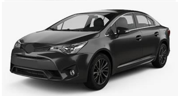
Toyota Avensis III Sedan T27 (2009-2018)