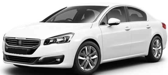
Peugeot 508 Sedan (2010-2018)

Instrucciones de instalación Istruzioni per l'installazione Upute za sastavljanje Instrucțiuni de montaj Návod na montáž